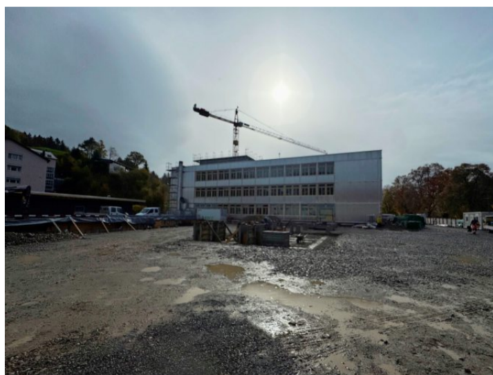
Auf der Nordseite des Gebäudes steht das Gerüst nicht mehr.

Entstehen wird der Campus Wattwil, der Kantons- und Berufsschule umspannt. Gewisse Teile der Infrastruktur wie etwa die Mensa oder Aula werden gemeinsam genutzt. Geplant ist auch eine zusätzliche Brücke über die Thur zur neuen Kantonsschule, bei welcher die Gemeinde Wattwil federführend ist.