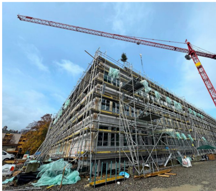
Das Aufrichtebäumchen steht. Der Rohbau der neuen Kantonsschule Wattwil auch.

troph Deutsch sagt zum weiteren Vorgehen: «Bis zum Jahresende sind nun im Inneren die groben, rohen Arbeiten an der Reihe.»